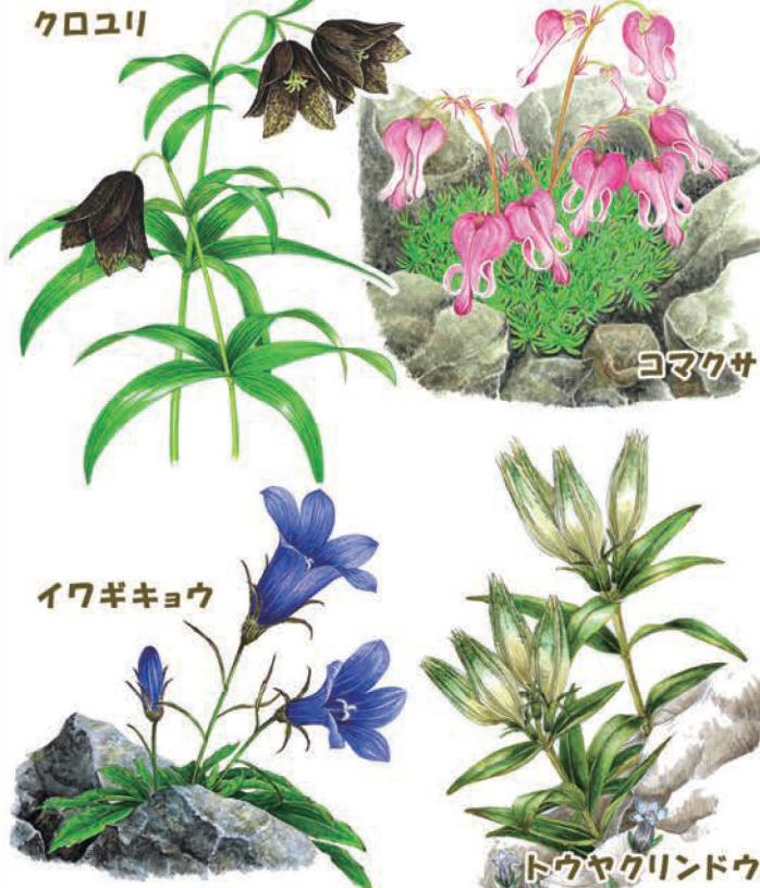
表紙の高山植物はハクサンイチゲ（左）ミヤマダイコンソウ（中央）キバナシャクナゲ（右）

登山道を彩る可憐な草花は、大切な命、みんなの宝物。写真に夢中で踏み潰したり採ったりしないでね。